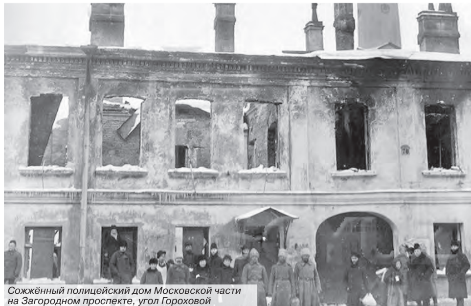
Сожжённый полицейский дом Московской части на Загородном проспекте, угол Гороховой

Все даты даны по старому стилю. (Прим. ред.)