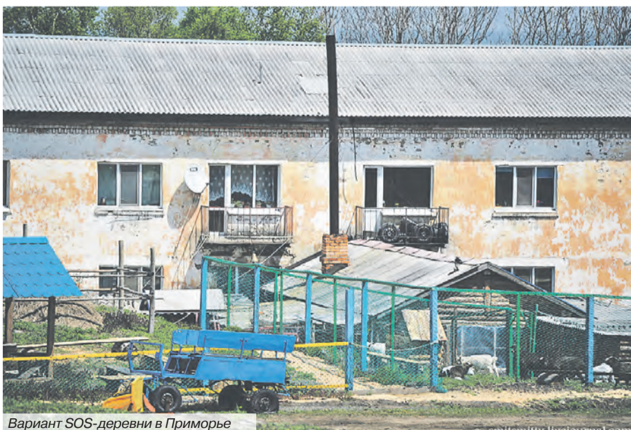
Вариант SOS-деревни в Приморье