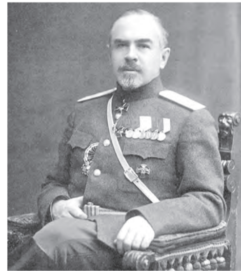
Градоначальник Петрограда Александр Балк

В этот день последний министр внутренних дел Российской империи Александр Протопопов, переодетый в штатское, пешком направился с набережной Фонтанки на Моховую улицу к члену Государственного Совета князю Голицыну. Возвратиться обратно не смог, получил записку о разграблении квартиры. Поздней ночью он прибыл в градоначальство, заслушал доклады и приказал генералу Балку объявить в приказе благодарность чинам полиции и молитвенно вспомнить «всех, запечатлевших своею кровью верность служебному долгу».