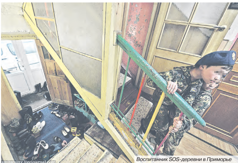
Воспитанник SOS-деревни в Приморье